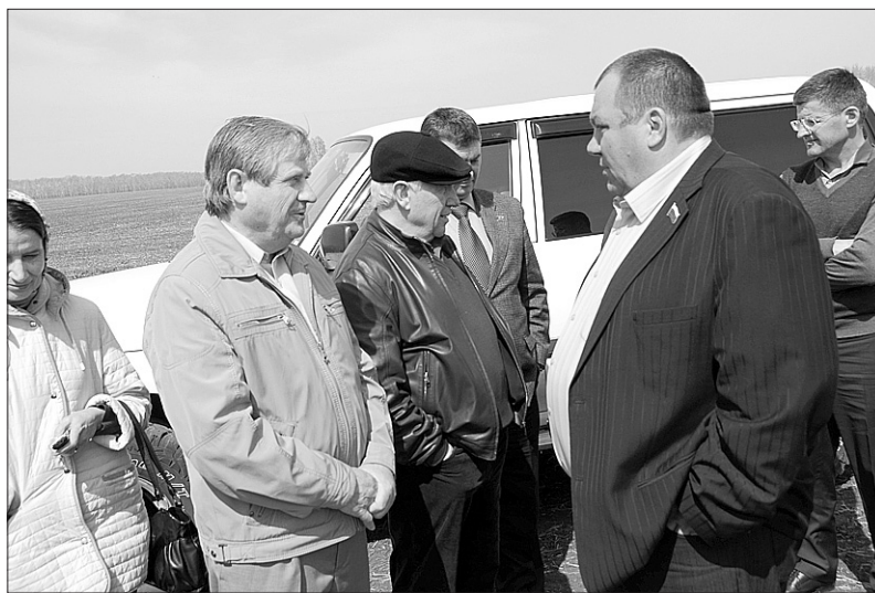
Депутаты побывали на полях, где идёт сев.