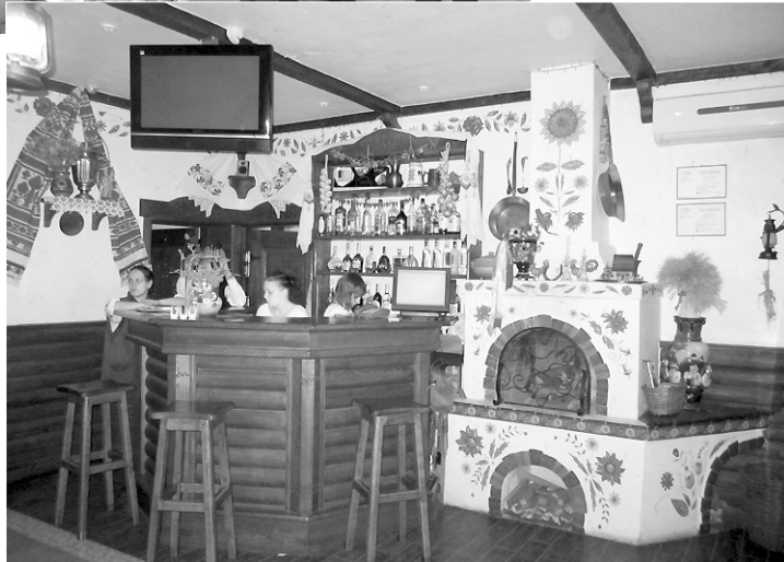
Убранство национального ресторана.